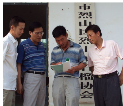
淮北市物价局烈山分局近日组织价格检查人员对该区农村行业协会和中介组织收费情况进行检查。图为检查人员在查看相关账簿资料。