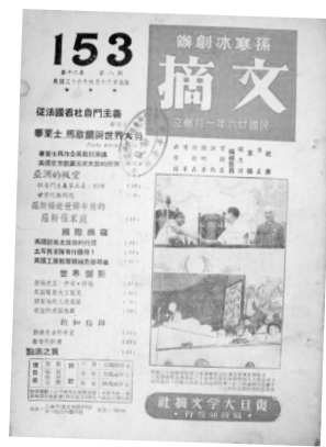
孙寒冰创办的《文摘》

1940年5月27日8时许,北碚警报台发出空袭警报,孙寒冰立即组织师生疏散隐蔽。日机向复旦校园里投弹,又用机关枪扫射,孙寒冰被炸身亡。1941年8月1日,复旦大学竖起了一块“复旦师生罹难和孙寒冰墓”,碑文中有“呜呼,惨遭寇弹,哀同国殇,全校师生,悲愤无极,将何以益自淬励我为文化工作之创造精神乎?抑何以益自坚强我为民族生存之战斗意志乎?是则吾辈后死者之责己”之句。