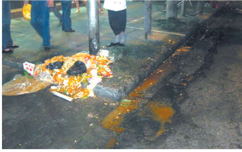
倒在下水道边上的垃圾