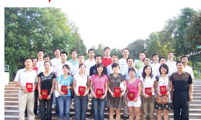
博士科技辅导员合影

咨询电话:0551-5591066 5593091 网址:school.hfcas.ac.cn