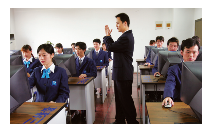
新华采用三梯度培养模式,帮助学生打好基础,提升实践能力,成为电脑高手。

中高考结束后,很多错失升学机会的学子纷纷通过各种渠道咨询学技能的问题。近日,在位于省城合肥的安徽新华电脑专修学院报名咨询中心,笔者看到来自全国各地的学子正在职业规划师的指导下,根据自身特