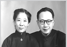
钱伟长、孔祥瑛夫妇