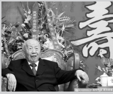
在苏州度过93岁生日