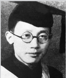
清华大学理学士毕业照