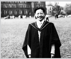
多伦多大学博士毕业留影