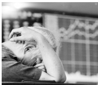
两市持仓账户数仅5386.78万户,环比减少25万户。 杨晓春