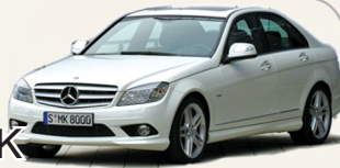
奔驰 C180 K

低碳生活正在一步步成为现实,豪华商务车也不能脱离这一趋势。奔驰顺势突出C180 K经典,相信会赢得更多高端消费者在这一生活理念上的共鸣。