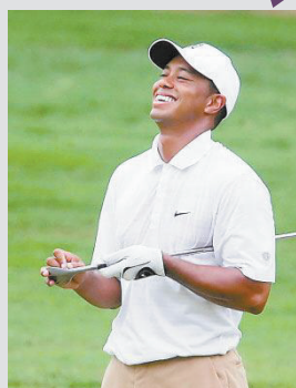
1 伍兹 美国 高尔夫 9050万美元