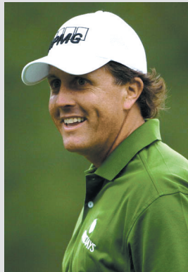
3 米克尔森 美国 高尔夫 6166万美元