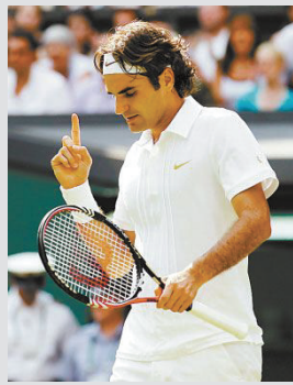
2 费德勒 瑞士 网球 6176万美元