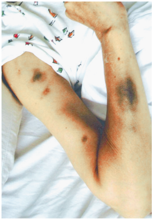
身上伤痕历历在目