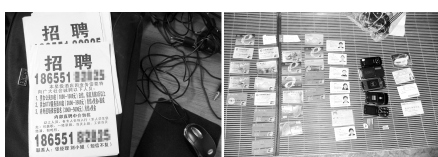
犯罪嫌疑人散发的招聘小广告