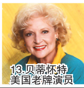
13.贝蒂·怀特 美国老牌演员