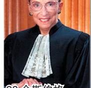
21.佩洛西 美国众议院女议长