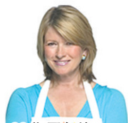
28.斯图尔特 美国国家政女