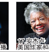
17.安杰卢 美国作家和诗人