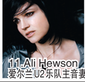
11. Ali Hewson 爱尔兰U2乐队主音妻子