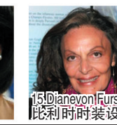
15. Dianvon Furstenberg 比利时时装设计师