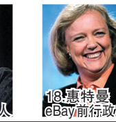
18.惠特曼 eBay前行政总裁