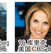
16.库里克 美国CBS女主播