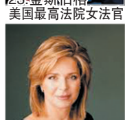
20.施莱弗 施瓦辛格夫人