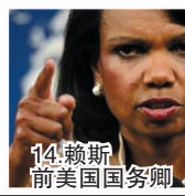
14.赖斯 前美国国务卿