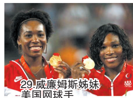
29.威廉姆斯姊妹 美国网球手