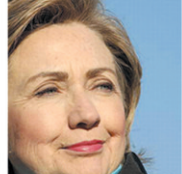
24.佩林 美国副总统候选人