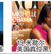
19.米歇尔 美国首位黑人夫人