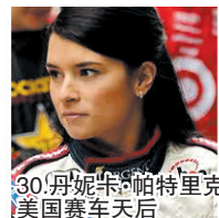
30.丹妮卡·帕特里克 美国赛车天后