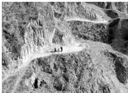
被修改后的获奖作品