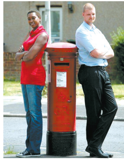
英国的凯莎和威尔科·凡·克莱夫·博尔顿夫妇身高之和达到4米,成为已申报吉尼斯世界纪录中世界上最高的夫妇。