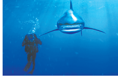
英国摄影师布赖恩·斯克里和同伴潜入巴哈马群岛附近海域跟踪一头白鳍鲨长达2小时。白鳍鲨极其凶猛,斯克里勇敢让他与这头鲨鱼面对面,并拍下珍贵照片。