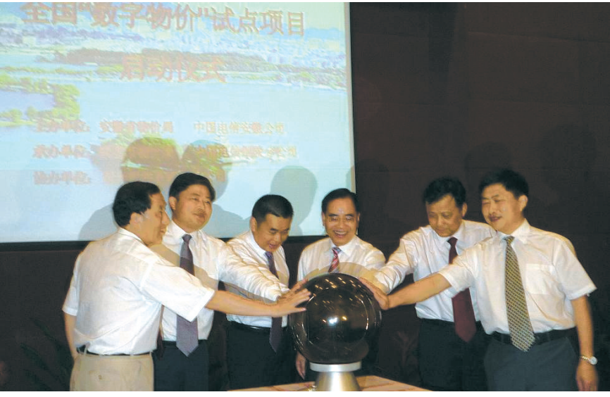
图为国家发改委价格司副司长周望军(左三),省发改委副主任、省物价局局长王建中(左四),铜陵市委副书记、市长李明(左二)及有关领导共同启动数字物价信息系统。

6月18日,全国数字物价信息系统试点项目启动仪式在铜陵举行,标志着全国首个数字物价系统正式起航。国家发改委价格司副司长周望军,省发改委副主任、省物价局局长王建中,市委副书记、市长李明等相关领导出席仪式。