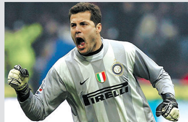
3 巴西队门将塞萨尔

点评：人说，好的门将能顶半支球队。一位优秀的门将，对于一支球队来说，往往起着至关重要的作用。