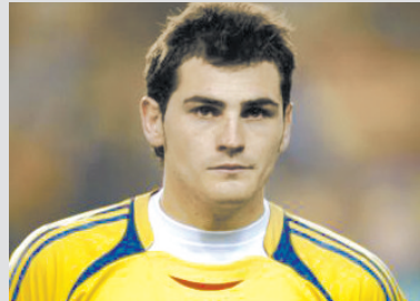
2 西班牙队门将卡西利亚斯