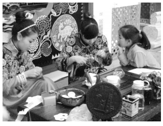
小姑娘,是不是想学绣花啊?