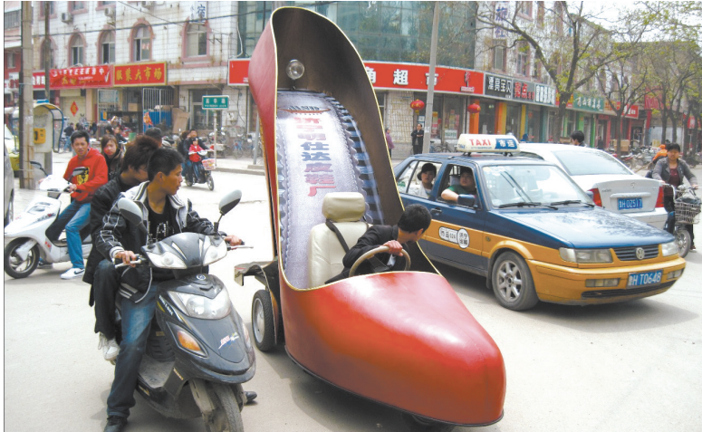
皮鞋车还真够雷 作者：翟杰（济宁）