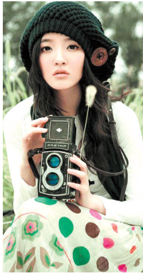
亚姐冠军——“文艺女青年”刘雨欣