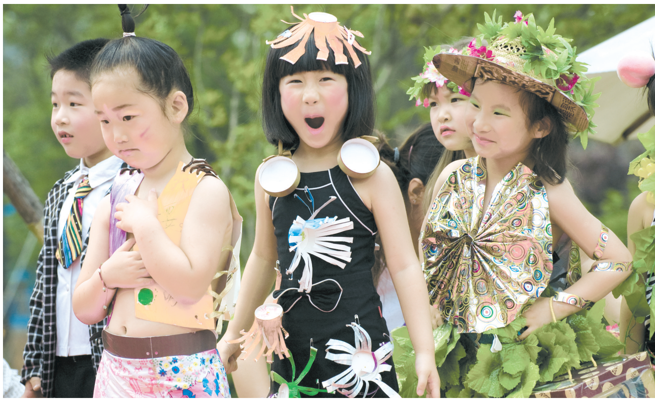
演出开始之前，尽管这几位小朋友的服饰有点“雷人”，但他们的可爱表情更吸引了我。作者：束从余（合肥）

不过呢，“雷”也是有轻有重，只要我们的眼光足够敏锐，总能在生活中发现一些有点雷，但也无伤大雅的现象吧。达不到被“雷”得外焦里嫩之效果又有何妨？毕竟，“雷雷更健康”嘛！