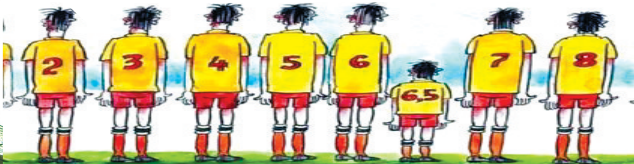
足球队里的6.5号球员