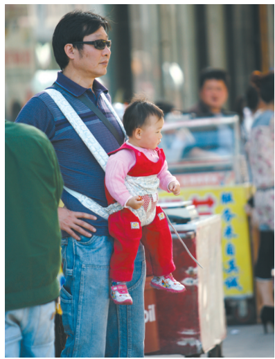
我爸有点酷 请作者联系本报