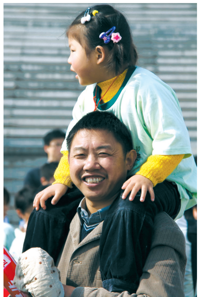
我爸有点憨 作者:解光文(肥西)

美国摄影师菲利普·特尔达诺在母亲去世后,拍下了与患有短期失忆症的父亲相处的点滴生活。摄影师与父亲彼此紧密的关系让简单平凡的生活影像变得意味深长。昨天是父亲节。和母亲相比,父亲们总是好像拙于表达对孩子的情感。但我们知道,与通常热烈的母爱相比,淡然却醇厚的父爱并不有所欠缺。