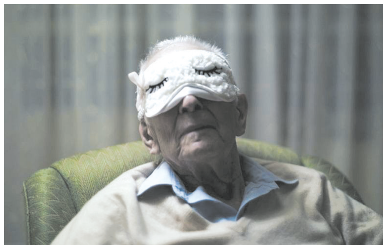
“这是我父亲的另一面——可爱,戴着眼套闭目养神”