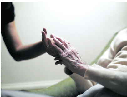
“年迈的父亲拉着我妻子的手”