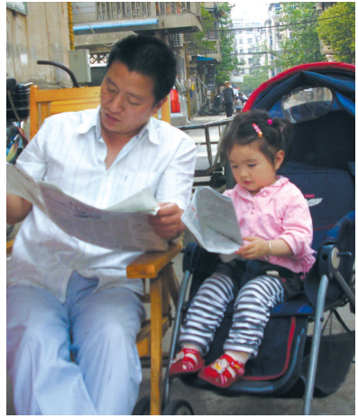
我爸爱学习 作者:孙勇(蚌埠)