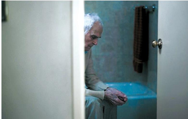
“因为没有短期记忆,父亲会在厕所里花掉不计其数的时间。”