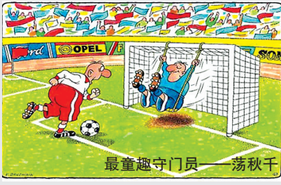
最童趣守门员——荡秋千