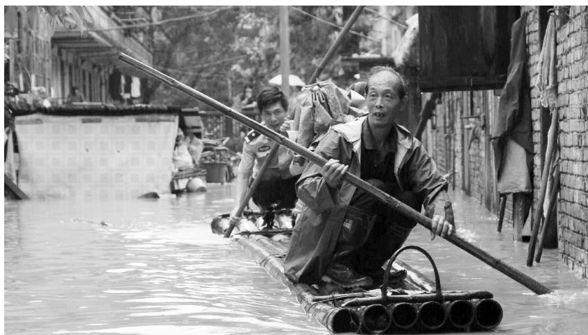
福建三明市民警在搜救遇险群众

预计17日起,长江中下游将进入降雨集中期,江南南部和华南地区仍将有较强降雨。气象专家建议,江南、华南等地相关部门密切关注雨情、水情、汛情变化,做好暴雨洪涝及山洪、滑坡、泥石流和强对流灾害的防御工作。农民朋友加强田间管理,做好清沟排涝,以防作物受淹倒伏。